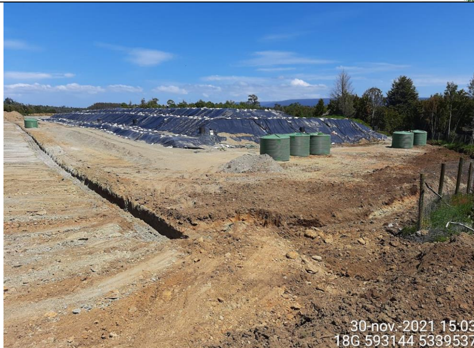
Fotografía N°22: Estado canales aguas lluvias