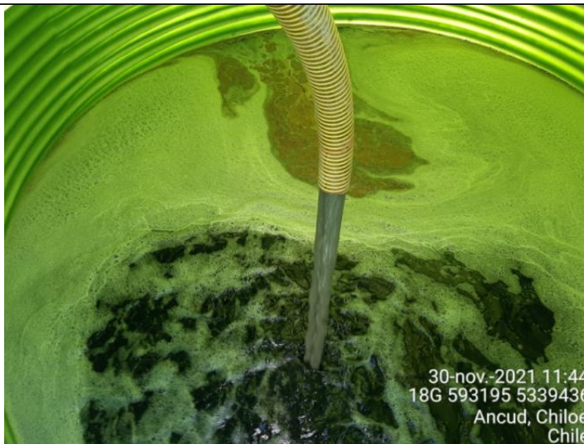
Fotografía N°4: Retiro de Lixiviados a estanque por Personal Municipal. Tomada: Martes 30 de Noviembre del 2021.