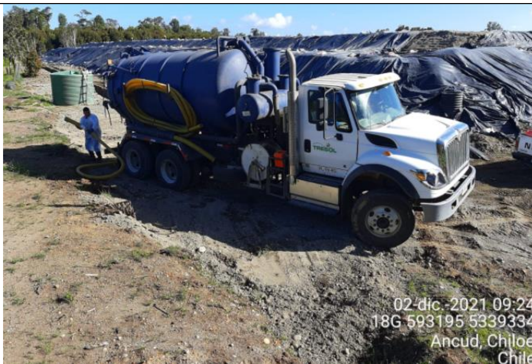
Fotografía N°8: Retiro de Lixiviados por empresa Tresol. Tomada: Jueves 02 de Diciembre del 2021.