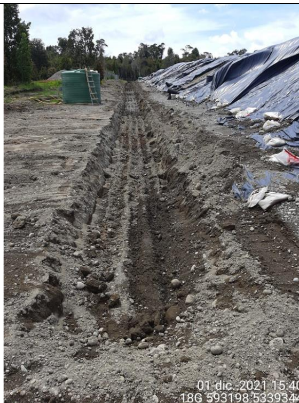
Fotografía N°23: Estado canales aguas lluvias