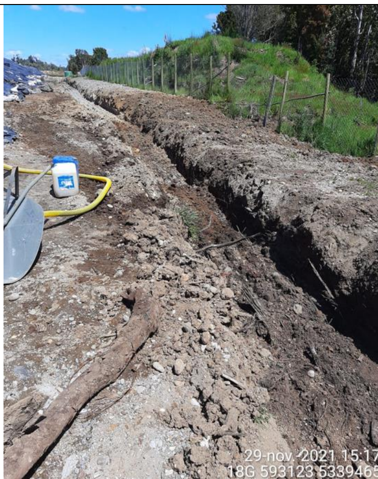
Fotografía N°21: Estado canales aguas lluvias