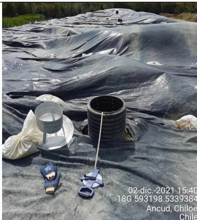
Fotografía N°18: Medición de Niveles de cámaras por Personal Municipal. Tomada: 02 de Diciembre del 2021.