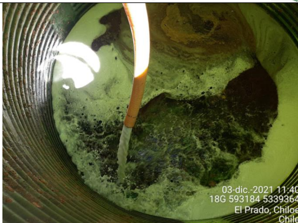
Fotografía N°10: Retiro de Lixiviados a estanque de acumulación. Tomada: Viernes 03 de Diciembre del 2021.