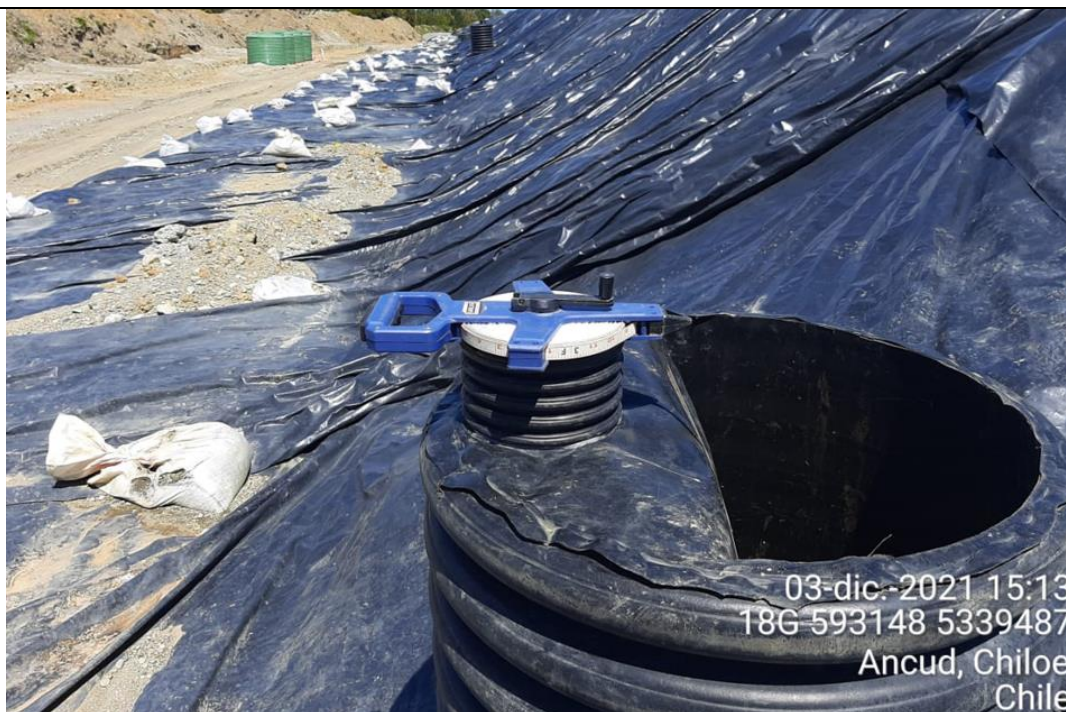
Fotografía N°19: Medición de Niveles de cámaras por Personal Municipal. Tomada: 03 de Diciembre del 2021.