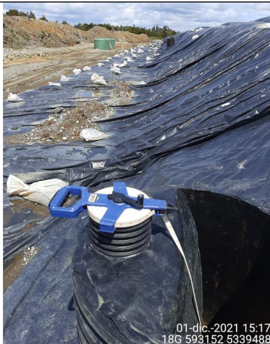
Fotografía N°17: Medición de Niveles de cámaras por Personal Municipal. Tomada: 01 de Diciembre del 2021.