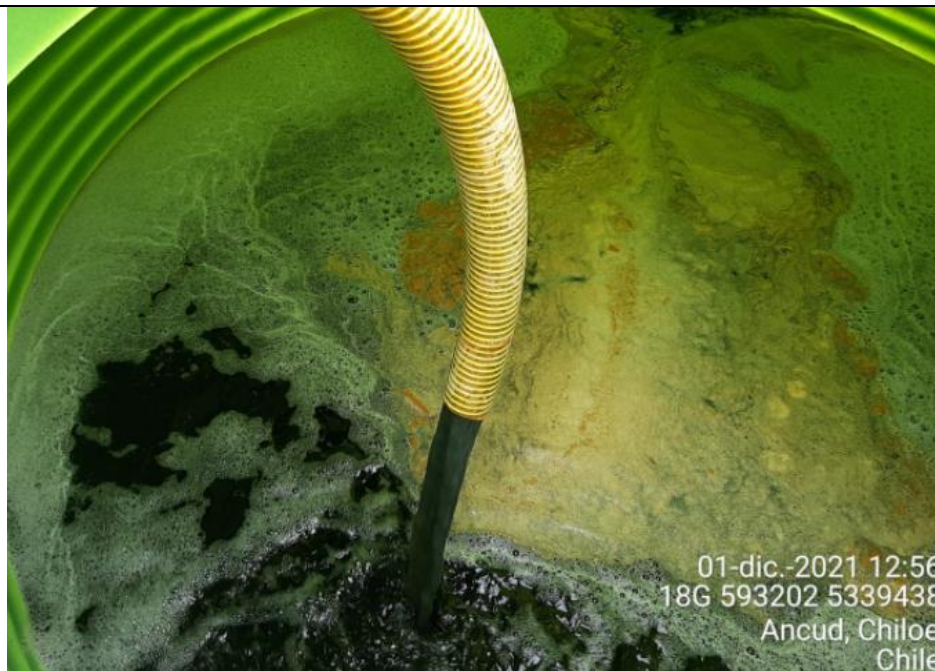
Fotografía N°6: Extracción de Lixiviados a estanque de acumulación. Tomada: Miércoles 01 de Diciembre del 2021.