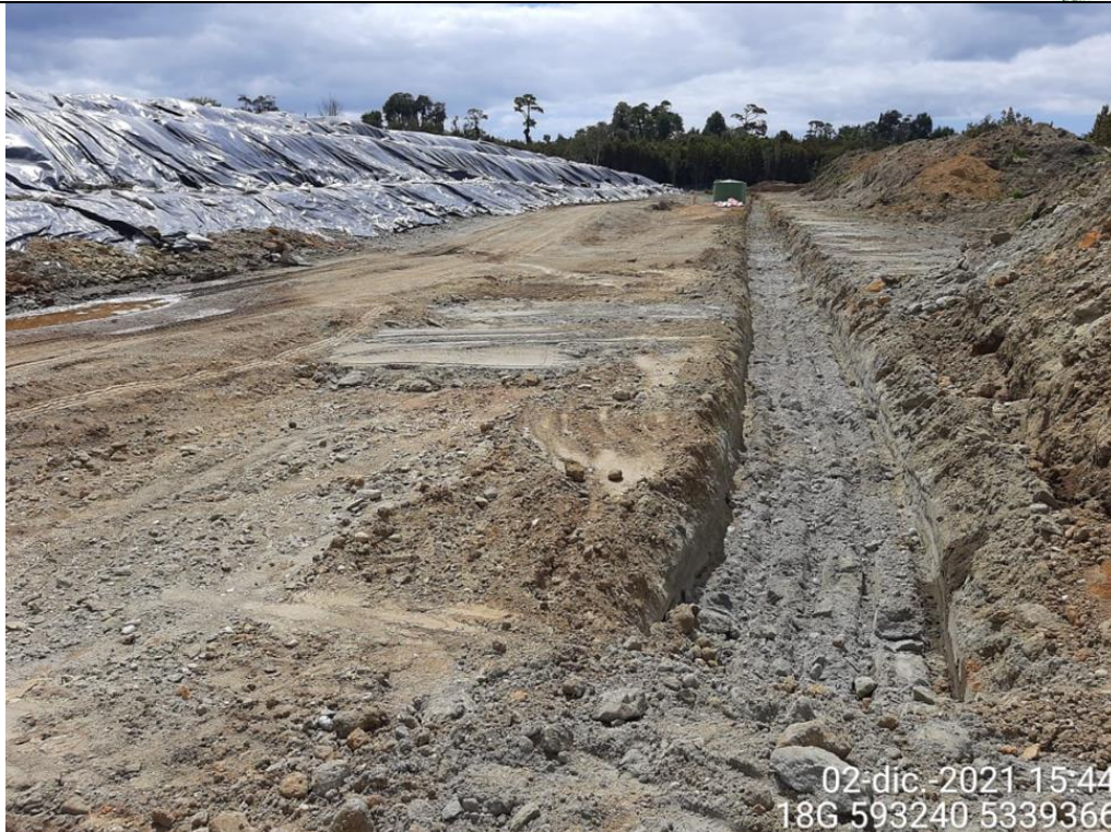
Fotografía N°24: Estado canales aguas lluvias