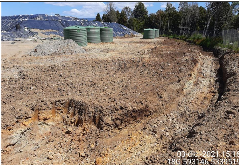
Fotografía N°25: Estado canales aguas lluvias