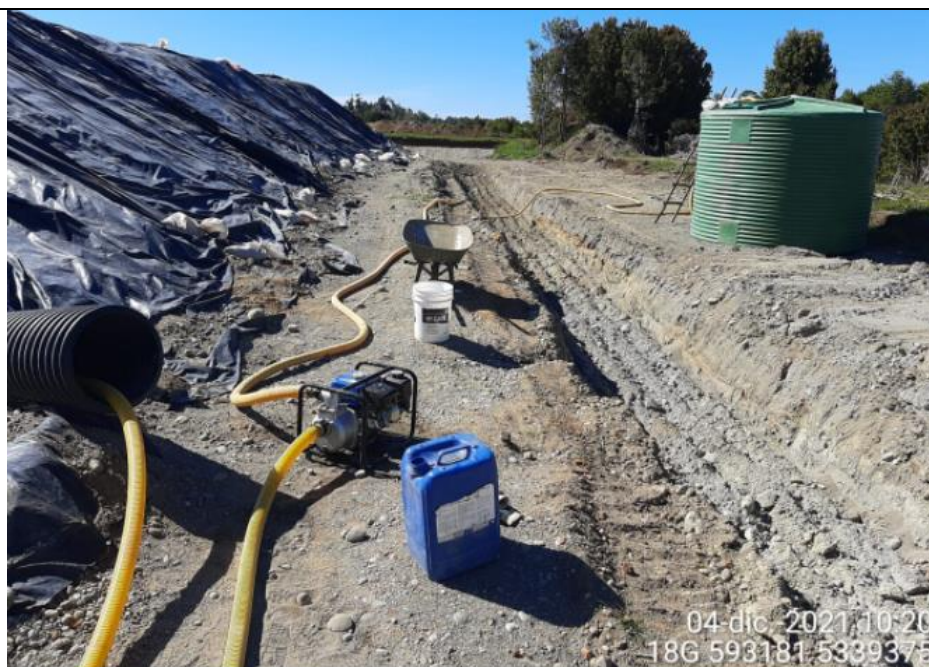
Fotografía N°11: Extracción de Lixiviados desde cámara diagonal D02. Tomada: Sábado 04 de Diciembre del 2021.