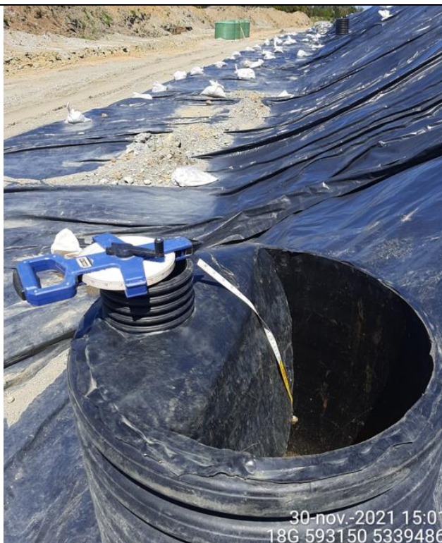
Fotografía N°16: Medición de Niveles de cámaras por Personal Municipal. Tomada: 30 de Noviembre del 2021.