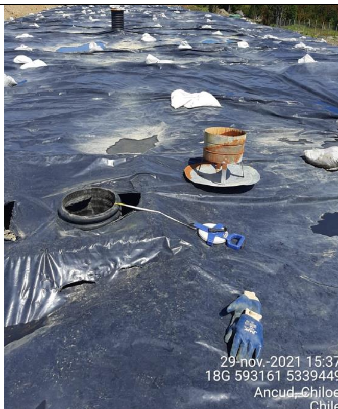
Fotografía N°15: Medición de Niveles de cámaras por Personal Municipal. Tomada: 29 de Noviembre del 2021.