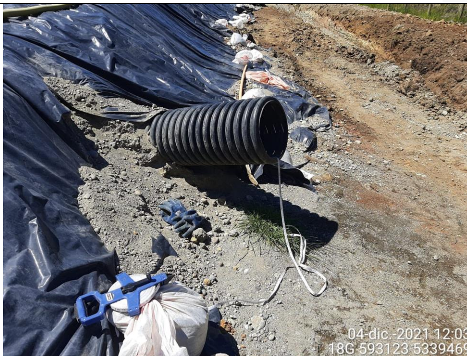
Fotografía N°20: Medición de Niveles de cámaras por Personal Municipal. Tomada: 04 de Diciembre del 2021