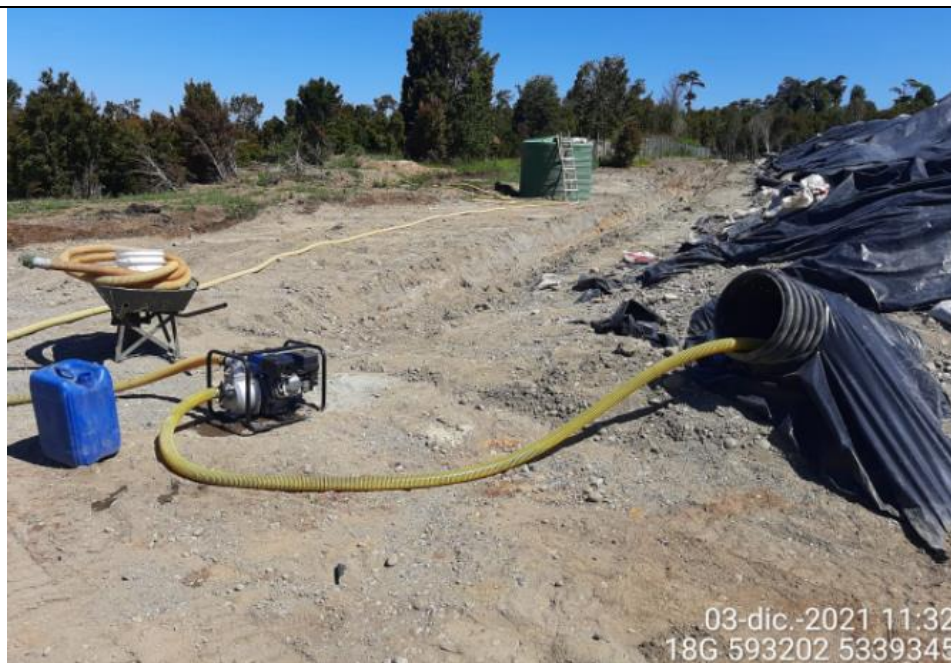
Fotografía N°9: Extracción de Lixiviados en diagonal D01. Tomada: Viernes 03 de Diciembre del 2021.