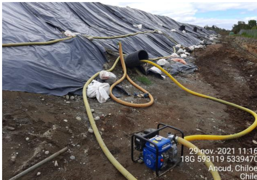
Fotografía N°1: Retiro de Lixiviados desde diagonal D04 por Personal Municipal. Tomada: Lunes 29 de Noviembre del 2021.

Para dar cumplimiento a lo indicado en Res. Exenta N°2481, emitida con fecha 18 de Noviembre del 2021. A continuación, se presenta el registro fotográfico de las actividades de extracción de la semana del 29 de Noviembre al 05 de Diciembre del 2021.