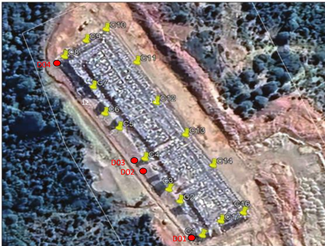
Fotografía N°12: Zanja Sanitaria N°1- Parte Norte. Imagen Aérea I. Municipalidad de Ancud.