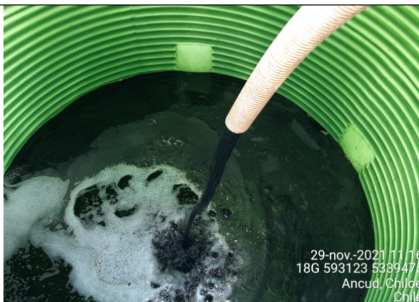
Fotografía N°2: Retiro de Lixiviados a estanque de acumulación por Personal Municipal. Tomada: Lunes 29 de Noviembre del 2021