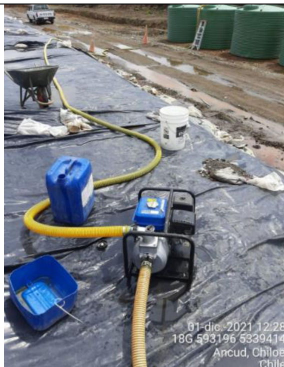
Fotografía N°5: Extracción de Lixiviados desde Cámara C13. Tomada: Miércoles 01 de Diciembre del 2021.