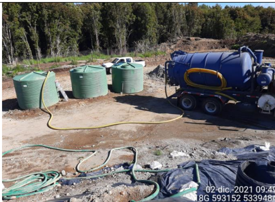
Fotografía N°7: Retiro de Lixiviados por empresa Tresol. Tomada: Jueves 02 de Diciembre del 2021.